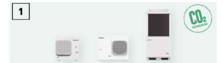
Unités de condensation au CO2 de la gamme CR pour chambre froide.

Panasonic PACi NX Elite offre une solution efficace et de haute qualité pour les applications de refroidissement à température positive telles que les installations de transformation des aliments.